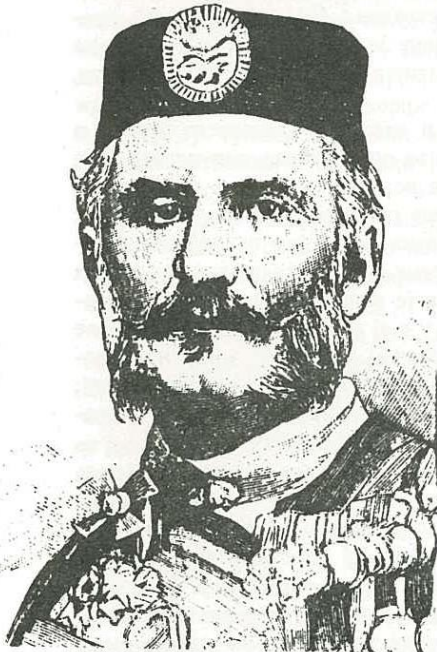
Краљ Никола Петровић

Још као деца слушали би песму, као аманет краља Николе где поручује: "Немојте ме копат ође, помого вам свети Ђорђе, већ ме носте на Цетиње, је су српске све светиње