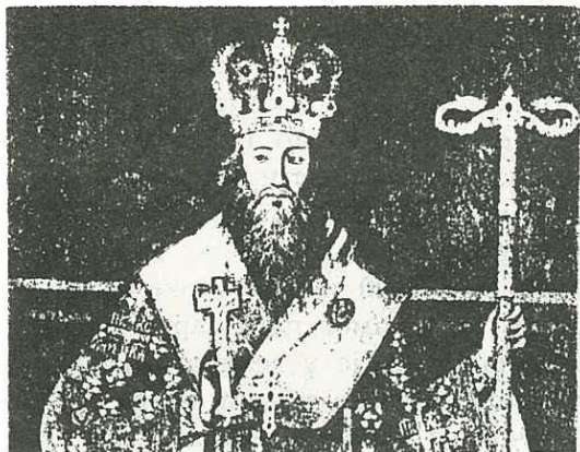
АРСЕНИЈЕ III ЦРНОЈЕВИЋ, ПАТРИЈАРХ СРПСКИ 1674—1706.