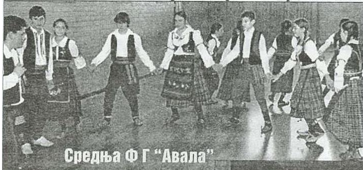
Средња Ф Г "Авала"

Четири ученице Српске школе "Свети Сава":